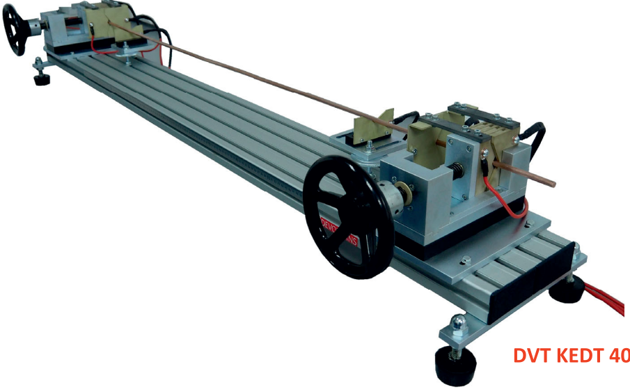
DVT KEDT 40